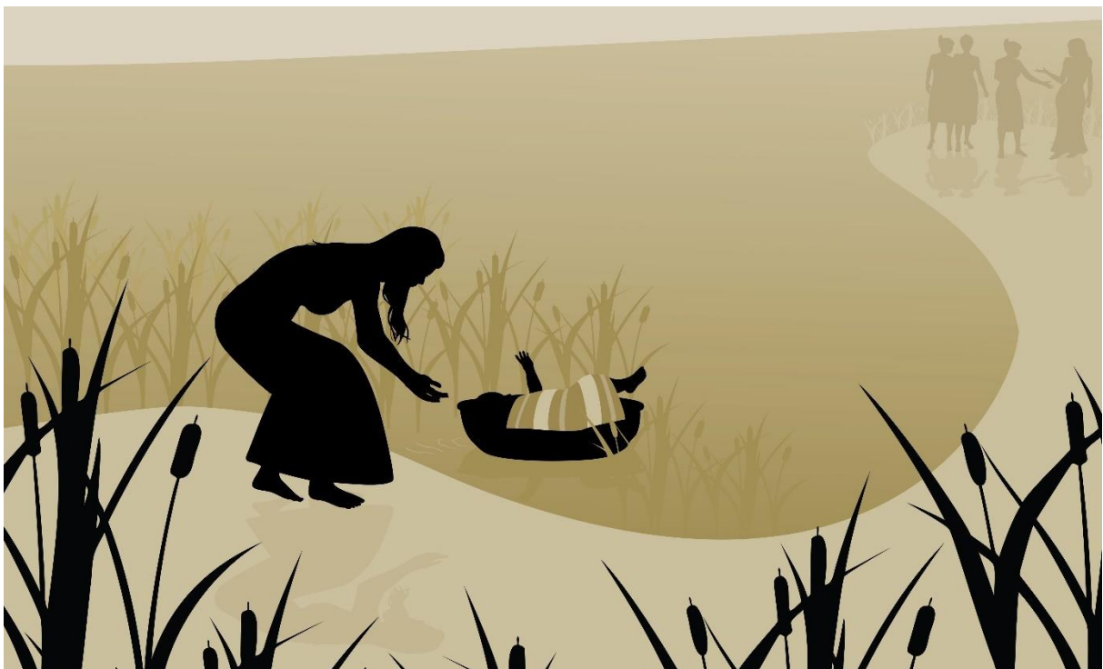
Moses blir lagt i en kurv.

I første mosebok i Det gamle testamentet i bibelen kan vi lese om at israelittene ble ønsket velkommen inn i Egypt. Men etter mange år ble han som bestemte i Egypt- Farao bekymret for at det ble for mange israelitter der. Derfor ble israelittene gjort til slaver og Faraoen befalte at alle guttebarn som ble født skulle drepes. Moren til Moses ville ikke at hennes barn skulle bli drept. Hun la han derfor i en kurv og plasserte kurven på elven Nilen. Hun håpet at noen skulle finne ham og ta godt vare på han. Det var datteren til Faraoen som fant Moses i kurven på elven. Hun passet godt på Moses. Derfor vokste Moses opp i familien til Faraoen.