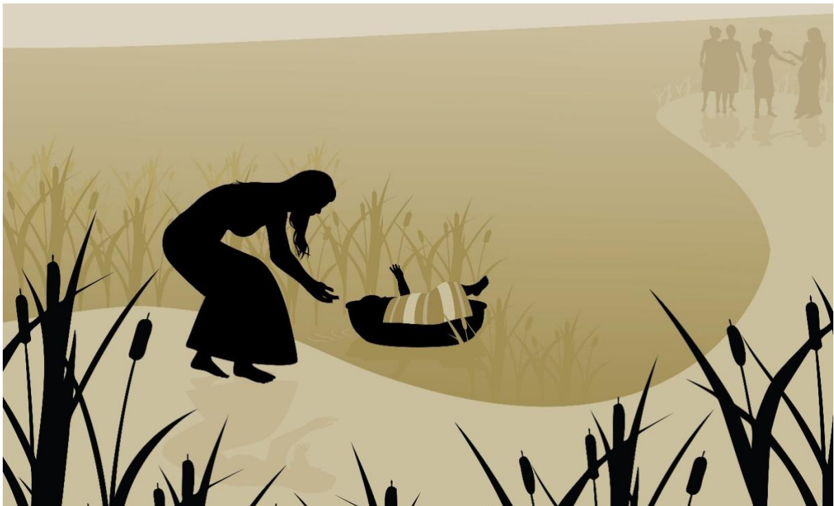
Моисея положили в корзину.

В Книге Бытия в Ветхом Завете Библии мы можем прочитать о том, что изначально израильтян встречали в Египте доброжелательно. Но спустя много лет фараон, глава Египта, начал беспокоиться о том, что израильтян стало слишком много. Поэтому их обратили в рабство, и фараон приказал, чтобы все новорождённые мальчики были убиты. Мать Моисея не хотела, чтобы её ребенок был убит. Поэтому она положила его в корзину и пустила ее по течению реки Нил. Она надеялась, что кто-то найдёт её сына и позаботится о нём. Корзину с Моисеем в реке нашла дочь фараона. Она забрала ее домой и хорошо его воспитывала. Таким образом он вырос в семье фараона.