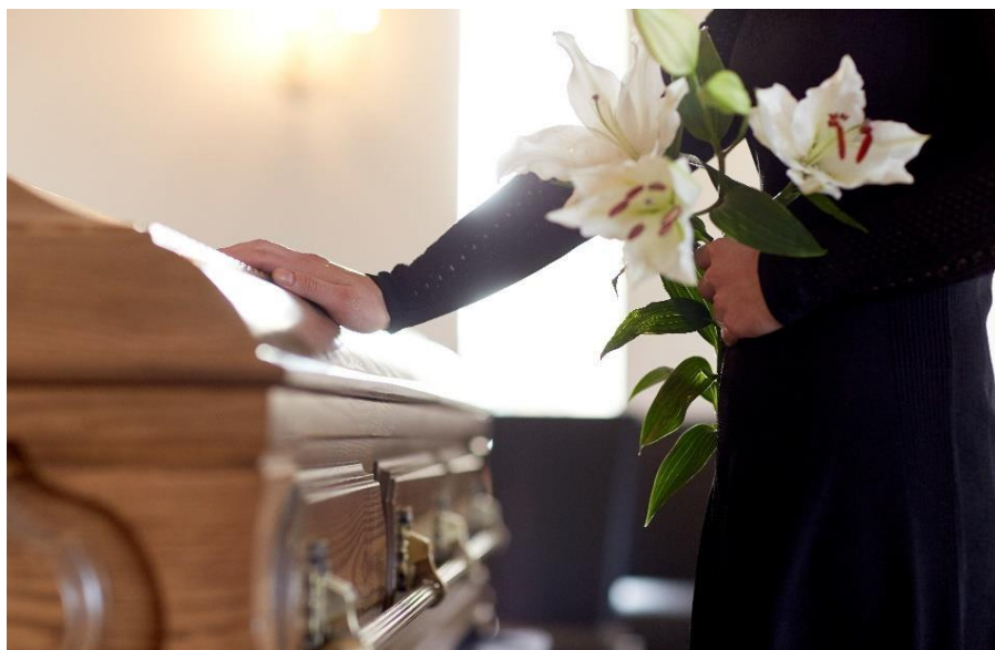
Bildet viser en dame som holder en hånd på en kiste..

Gravferd er en seremoni til minne om den døde. Det finnes ingen humanistisk gravplass, så den døde blir vanligvis gravlagt på kirkegården.