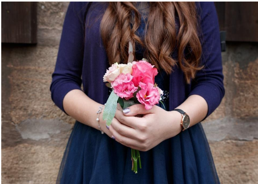
Bildet viser ei jente på konfirmasjonsdagen

Humanistisk konfirmasjon er et kurs i etikk og livssyn. Kurset avsluttes med en høytidelig seremoni. Alle ungdommer som ønsker det, kan velge Humanistisk konfirmasjon.