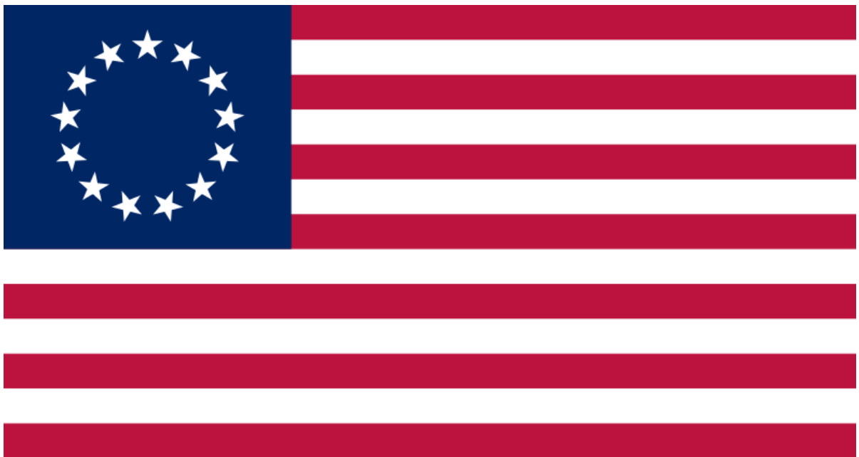
Betsy Ross flag - DevinCook / laget av jacobolus med Adobe Illustrator, offentliggjort i public domain., Public domain, via Wikimedia Commons

Pierwsza flaga USA. 13 gwiazdek oznacza 13 pierwszych stanów, z których składało się USA.