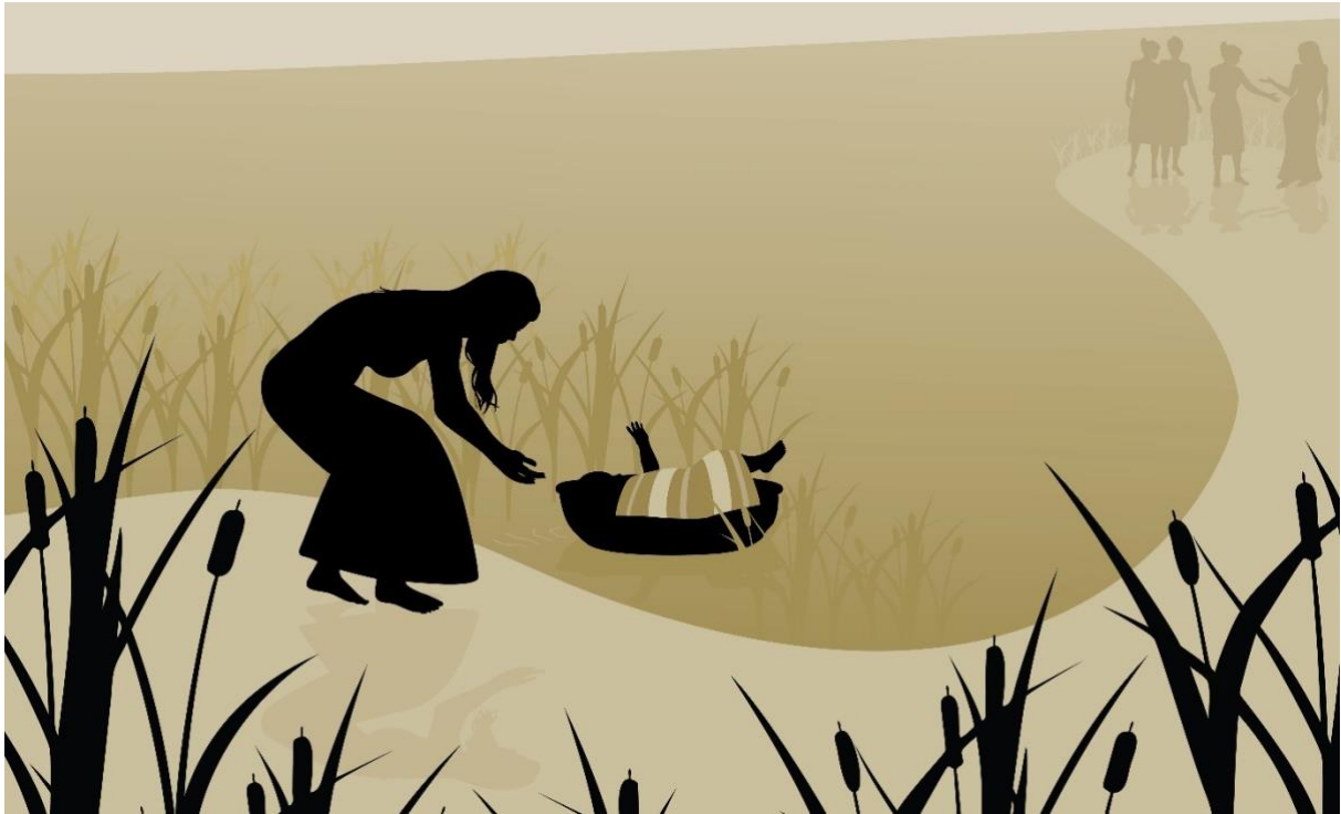
Moses blir lagt i en kurv.

Nang lumaki si Moises, nagpakita ang Diyos kay Moises bilang isang nagniningas na palumpong. Sinabi ng Diyos sa kanya na tulungan niya ang mga alipin sa Ehipto, at na si Moises ay isa ring Israelita. Ang sarili niyang mga tao ang nagdurusa sa ilalim ng pagkaalipin ng taong tinatawag niyang ama. Sinabi ng Diyos kay Moises na dapat hilingin ni Moises kay Paraon na palayain ang mga alipin. Si Moises ay dapat mamunu para makalabas ang mga Israelita sa Ehipto papunta sa ibang lupain na kung tawagin ay lupain ng Canaan.