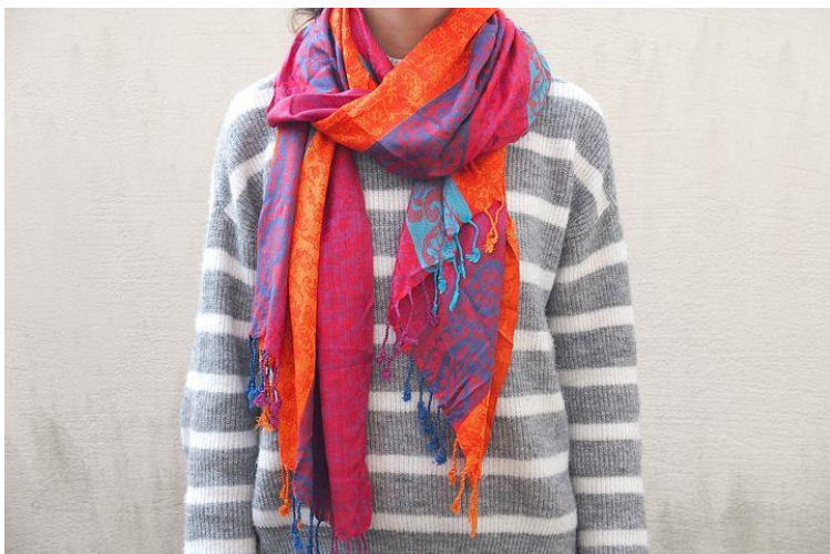
Foto av eit skjerf frå Pixabay

Skjerf er eit klesplagg ein har rundt halsen når det er kaldt ute.