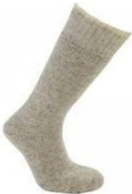
Foto av ein ullsokk

Ullsokkar er sokkar som er laga av ull. Ullsokkar nærmast huda held på varmen. Nokre strikker ullsokkar sjølve, andre kjøper på butikken.