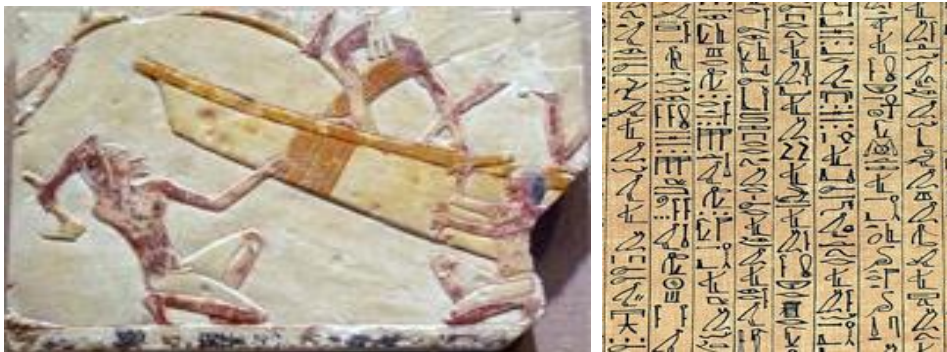
Huner a ku xêza çêkirina qeyikên misrî û nivîsa heroglîfî diyar dibe

Misriyên kevnar şêweyekî nivîsandinê yê bi navê nivîsa Heroglîfî afirandin. Di dema ku xelkên Mezopotamya li ser depên ji heriyê hatibûn çêkirin dinivîsandin, misriyan li ser pelên papîrus dinivîsandin.