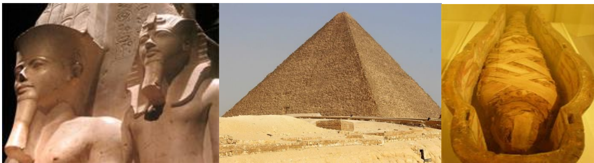
Wêneyên ku Fîrewnanan, pîramîda Keops û mûmyayan nîşan didin

Di destpêkê de mirî bi şeweyekî taybet dişûştin, pişt re mejî û hinav ji bilî dil derdixistin û ew dixistin hin şerbikên taybet de. Melhem û rûnên curbicur di laşê mirî de didan, pişt re tevaya laş bi paçin dirêj dipêçan. Û di dawiyê de ew kesê mûmyakirî dixistin tabûteke taybet de û wêneyekî wî/wê li ser tabûtê xêz dikirin.