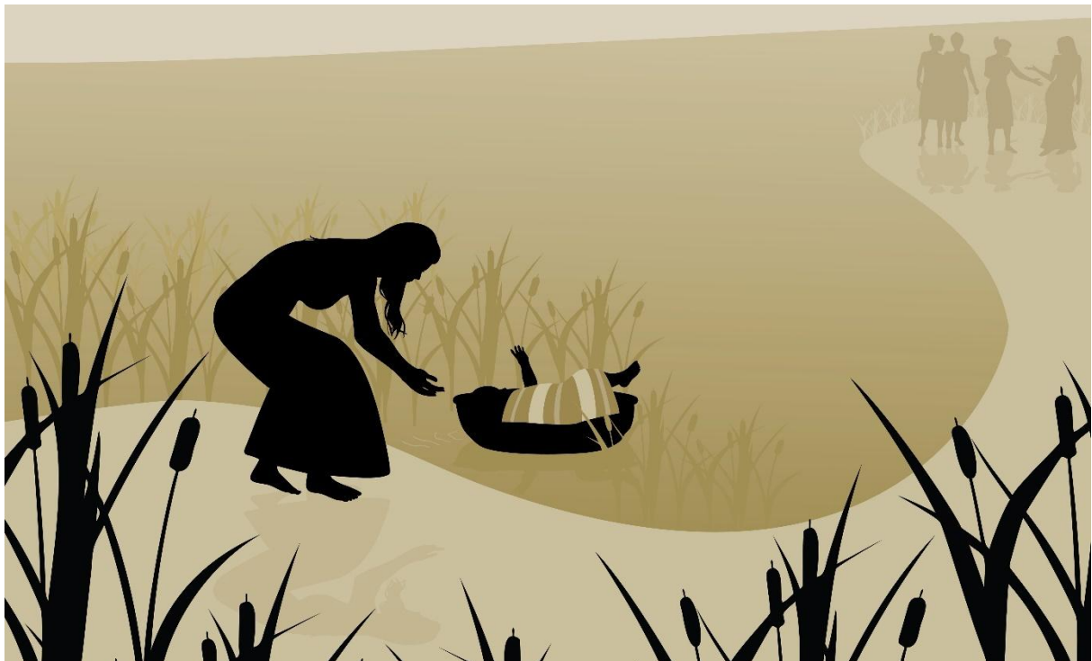
Moses blir lagt i en kurv.

Mugitabo cy'itangiriro Mw'isezerano rya kera muri bibiriya handiswe ko abisiraheli bahawe ikaze muri Egiputa. Ariko hanyuma y'imyaka myinshi Farawo wari umutware w' Egiputa yahangayikishijwe no kuba umubare w'abisiraheli wari umaze kuba mwinshi. Kubwibyo Abisiraheli bagizwe abacakara kandi Farawo atanga itegeko ko buri mwana wumuhungu wari wavutse yicwa. Nyina wa Musa ntabwo ya shakaga ko umuhungu we y'icwa. Amushira mugiseke nuko atereka igiseke kumugezi witwa Nile. Yizeraga ko hari uzamubona akamumucungira neza. Ni umukobwa wa Farawo wabonye icyo giseke Musa yarimo kumugezi, amufata neza( amurera neza) . Nguko uko Musa yakuriye mu muryango w'umwami Farawo.