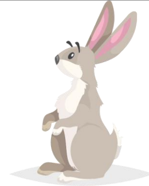
HAREMANN HOPSADANS Kiškis piškis (kishkis pishkis)