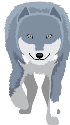
ULVEN ALDRIMETT Vilkas pilkas (vilkas pilkas – tjukk L)