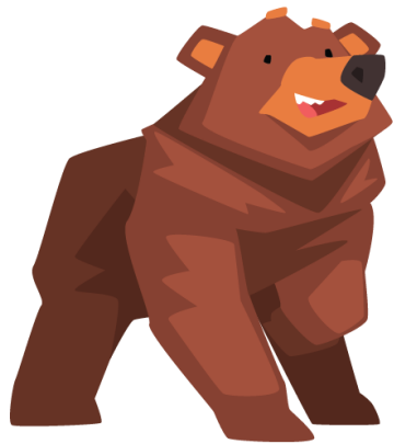
BAMSEFAR LABBDIGER Meška lepeška ( meshka lepeška )