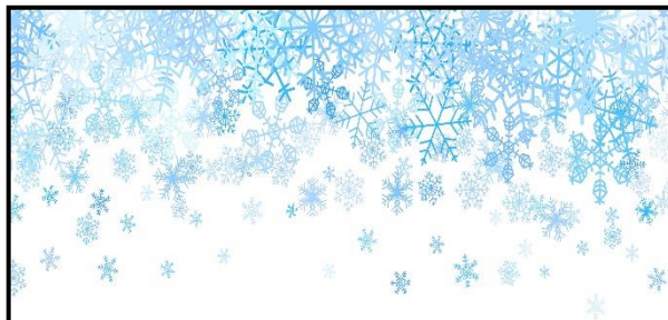
SNØ Sniegas ( sniegas )