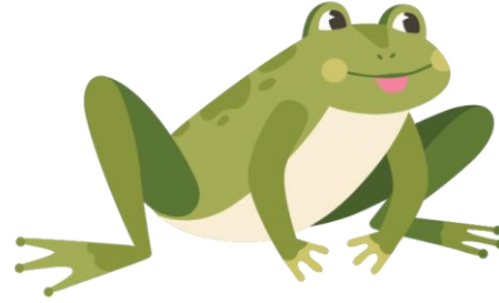
FRISKEFROSK LANCELÅR Varlytė šoklytė (varlite shoklite)