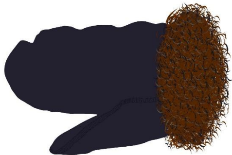
SKINNVOTTEN Pirštinė ( pirshtine )