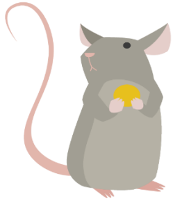
PILEMUS SILKEHÅR Pelytė smailianosytė (pelite smailanāsite)