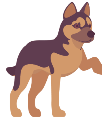
HUNDEN Šuo ( sh(u)å )