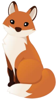
REVEMOR SILKESVANS Lapė snapė (lape snape – tjukk L)