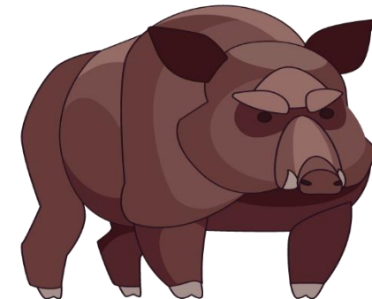
VILLSVINET TRYNEBRETT Šernas knyslius (shernas knislus - rulle R)