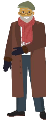
DEN GAMLE MANNEN Senelis ( senælis )