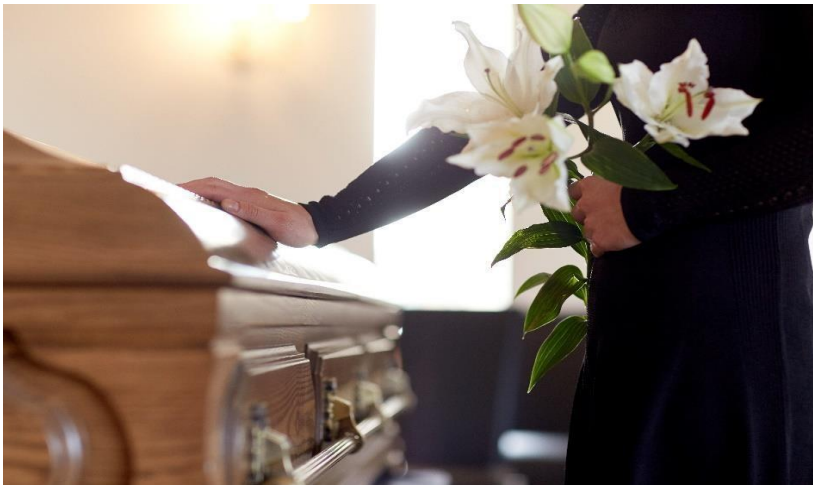
Bildet viser en dame som holder en hånd på en kiste..

Cenaze, ölülerin anısına yapılan törendir. Hümanist bir mezarlık yoktur, bu nedenle ölüler genellikle mezarlığa gömülür..