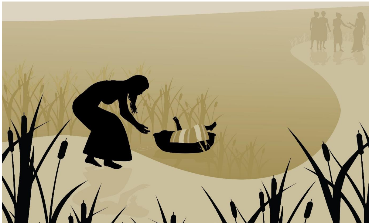
Moses blir lagt i en kurv.

په لرغونی انجیل کی د موسی په لومړي کتاب کې، د اسی لولو چې مصر ته د اسراییلیانو د راتک ښه هر کلی وشو. خو څو کاله وروسته د اسراییلیانو په ډیریدو سره هغه چا چې په مصر کې پریکړه کړی وه - فرعون اندیښمن شو . نو له همدې امله بني اسرائیل یی غلامان کړل او فرعون امر وکړ چې د اسراییلو ټول هغه نوی زیږیدلی هلکان دې ووژل شي. د موسی علیه السلام مور نه غوښتل چې ماشوم یی ووژل شي. له دې امله خپل زوی یی په یوه ټوکرۍ کې کېښود او ټوکرۍ یی د "نیل" په سیند کې خوشې کړه. په دی هیله چې یو څوک به یی وموي او ښه پاملرنه به یی وکړي. د فرعون موسی علیه السلام یی د سیند پر غاړه په ټوکرۍ کې وموندلو. او هغی د موسی علیه السلام ښه پاملرنه وکړه. له همدې امله موسی علیه السلام د فرعون په کورنی کې لوی شو.