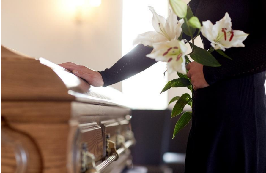
Bildet viser en dame som holder en hånd på en kiste..

Mazishi ni sherehe inayofanyika kumkumbuka aliekufa. Hakuna eneo la mazishi la watu wenye mtazamo wa maisha wa kibinadamu hivyo wanaokufa wanazikwa katika makaburi ya kanisani.