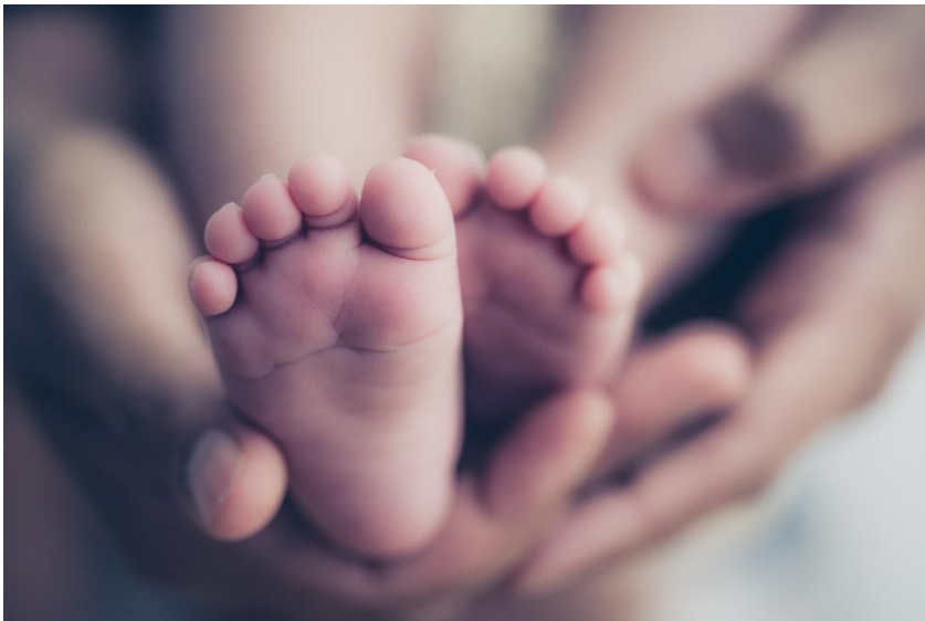
Bildet viser to babyføtter som blir holdt av en voksens hender.

Sherehe ya ubatizo ni sherehe ya kumtambulisha mtoto kwa kumpatia jina uandaliwa kumkaribisha mtoto duniani na kusherekea kuwa amepata jina na utambulisho.