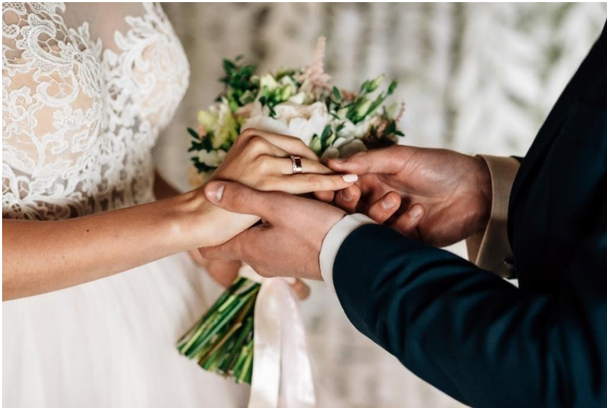
Bildet viser en mann og en dame som gifter seg. Bruden har på seg hvit kjole og brudgommen har på seg en mørkeblå dress. Brudgommen setter ringen på brudens finger. Bruden holder en bukett i den ene hånden.

Harusi ni sherehe nzuri inayofanyika kuthibitisha kwamba watu wawili wamechaguana. Ndoa ni ya wapenzi wa jinsia tofauti na jinsia moja. Ili kuweza kufanya harusi ya kibinadamu, mmoja wa watu wanaoana lazima awe mwanachama wa Chama cha kimaadili cha binadamu nchini Norwe.