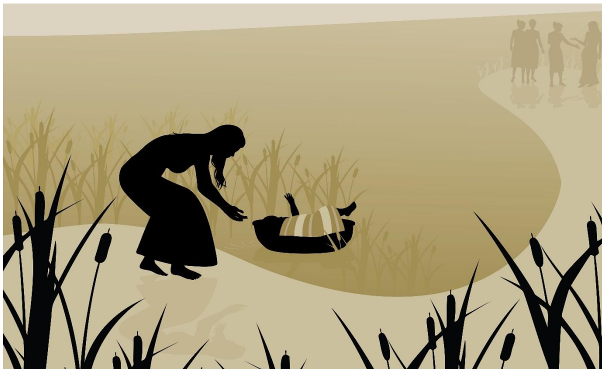
Moses vert lagt i ei korg.

I fyrste mosebok i Det gamle testamentet i bibelen kan me lese om at israelittane vart ynskt velkomen inn i Egypt. Men etter mange år vart han som bestemte i Egypt- Farao bekymra for at det vart for mange israelittar der. Difor vart israelittane gjort til slavar og Faraoen befalte at alle guteborn som vart føydd skulle drepast. Mora til Moses ville ikkje at hennar born skulle bli drepne. Ho la han difor i ei korg og plasserte korga på elva Nilen. Ho håpa at nokon skulle finne han og ta godt vare på han. Det var dottera til Faraoen som fann Moses i korga på elva. Ho passa godt på Moses. Difor vaks Moses opp i familien til Faraoen.