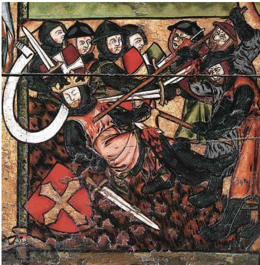
Fotografi av alter

29. juli 1030 stod Olav Haraldsson klar til kamp på Stiklestad. Han hadde berre klart å samle 3600 mann. Motstandarane hadde fire gonger så mange krigarar. Det vart eit blodig slag. Olavs menn kjempa tapper, men måtte til slutt gje opp. Ein av fiendane traff kongen i låret med øksa si. Like etterpå fekk Olav eit spydstikk i magen. Etter at han òg hadde fått eit sverdhogg i halsen, døde han. Olav den heilages dødsdag 29. juli kallast «Olsokdagen».