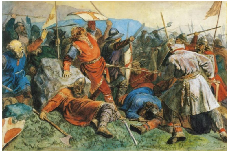
Maleri: Peter Nicolai Arbo, lisens: fri.